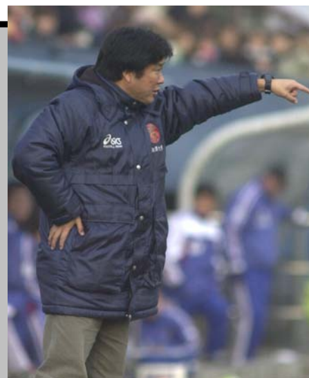
秋田監督は開幕戦という重要な試合でどんな采配を振るうのか

このメンバーはあくまで予想。監督は近年、開幕戦でおもいきった采配をするため今回もいくつかの驚きがあるかもしれない。新入生からの抜擢も考えられないことはない。開幕戦、果たしてどんなメンバーがピッチにたっているのだろうか。